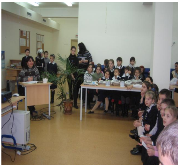
Читальный зал переполнен